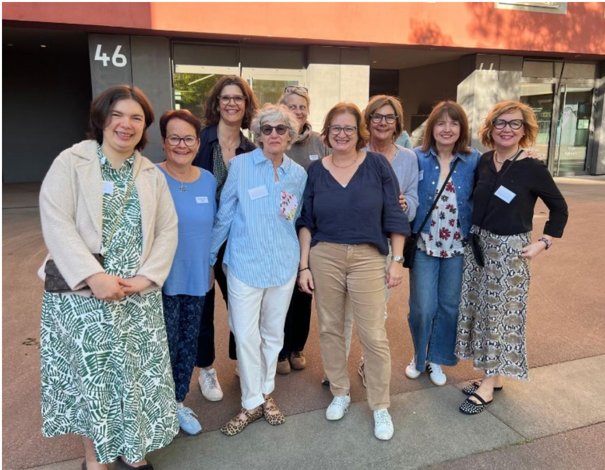
Diese Helferinnen machten den tollen Tag möglich!